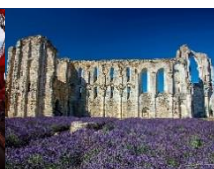
L'abbaye de Maillezais