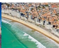
Les Sables d'Olonne